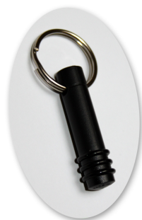
Elektronische sleutel (keytag)