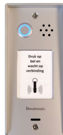
Antenne geïntegreerd in de Multicom deurpost